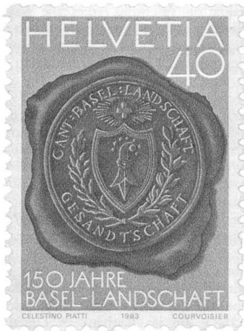
Abb. 2. Briefmarke vom 26. Mai 1983 « 150 Jahre Basel-Landschaft ».

Der früheste Nachweis des Wappens ist auf das Jahr 1833 festzusetzen: Im Bundesarchiv zu Bern liegt je ein Siegel und ein Wappen in zwei Aktenbeständen mit Beilagen zu den Tagsatzungsprotokollen von 1833 und 1836. Das Wappen zeigt einen nach rechts gewendeten Baselstab mit sieben Krabben 4 . Auf dem roten runden Siegel mit der Umschrift CANTON BASEL-LANDSCHAFT LANDRATH finden wir dasselbe Wappen mit dem Unterschied, dass hier die Krabben nicht mit dem Knauf verbunden, sondern von diesem durch einen schmalen Zwischenraum abgetrennt sind.