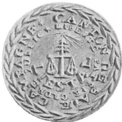
Abb. 1. Siegel «Canton de Bâle Campagne» (aus (2), S. 19, Bild 7).

Die ins Exil geflohene «Provisorische Regierung» besass ein Siegel mit den typischen Revolutionselementen Waage, Freiheitsbaum und einen Stern mit Strahlenkranz (Abb. 1). Die Umschrift lautet CANTON DE BÂLE CAMPAGNE, im inneren Kreis steht geschrieben LIBERTÉ, PATRIE, ORDRE PUBLIC, LIESTAL.